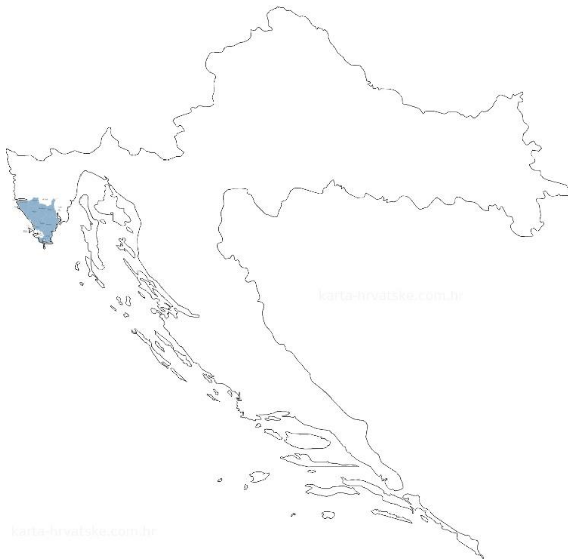
Slika 2: Karta položaja LAG-a na karti Republike Hrvatske